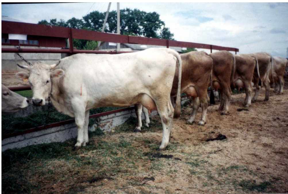
Рисунок 1 – Коровы костромской породы ОАО «Племзавод «Каравачево»

Каждая иллюстрация должна отвечать тексту. Все иллюстрации должны быть пронумерованы и подписаны. Обычно используется сквозная нумерация (см. рис. 1).