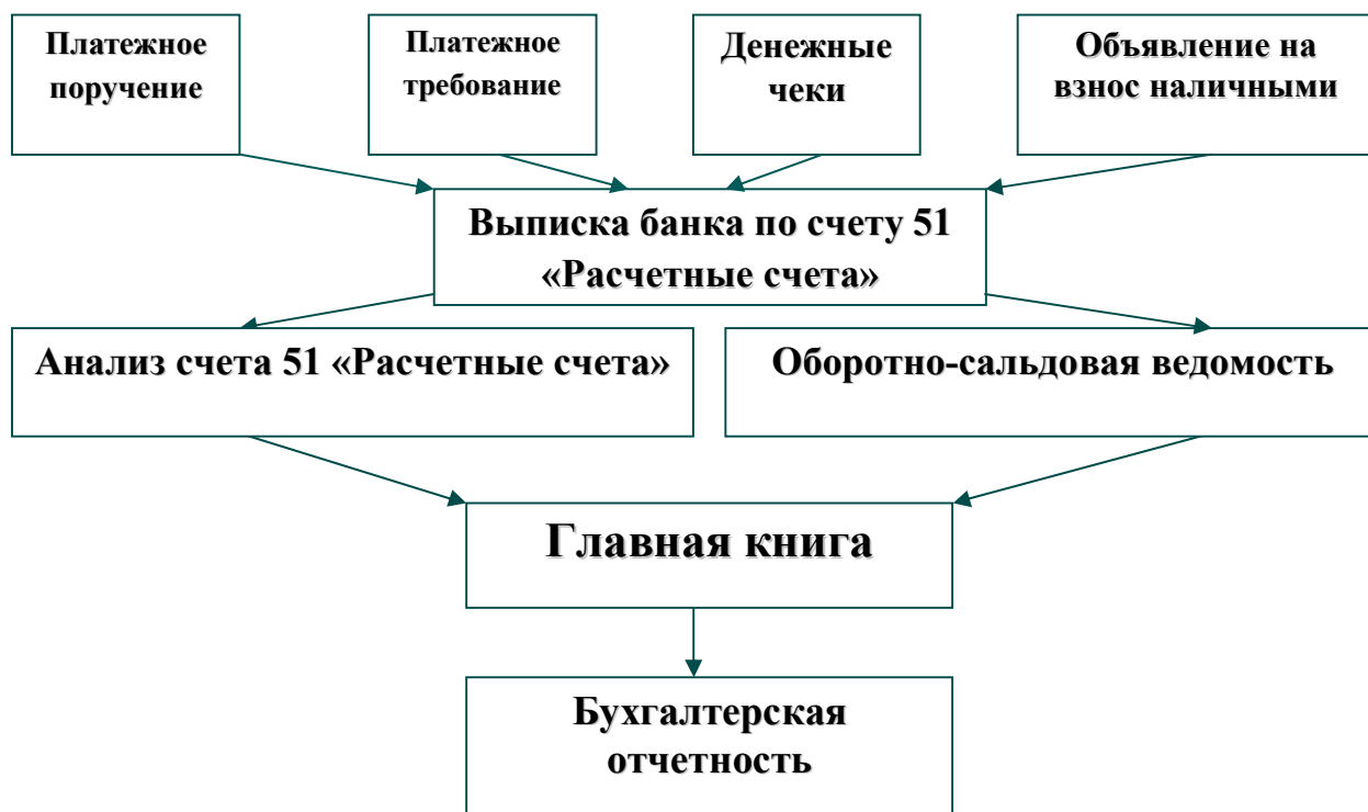
Рис. 2. Пример оформления документооборота по поступлению и выбытию денежных средств на расчетном счете (при автоматизированной форме учета)

Этот синтез – последовательное, логически стройное изложение полученных итогов и их соотношение с общей целью и конкретными задачами, поставленными и сформулированными во введении.