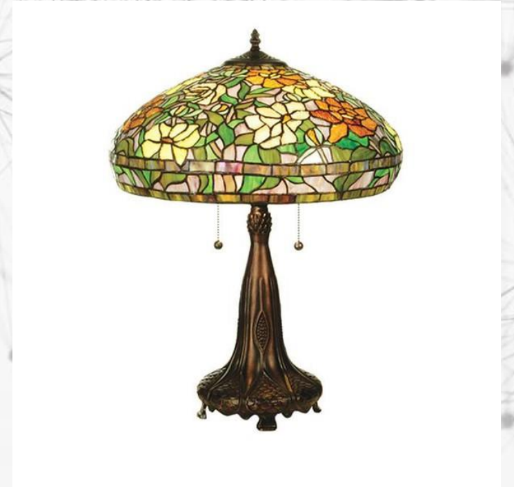
Tiffany Peony Table Lamp