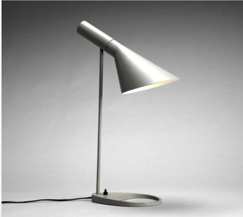
Модель AJ Table от фабрики Louis Poulsen, дизайн Jacobsen Arne