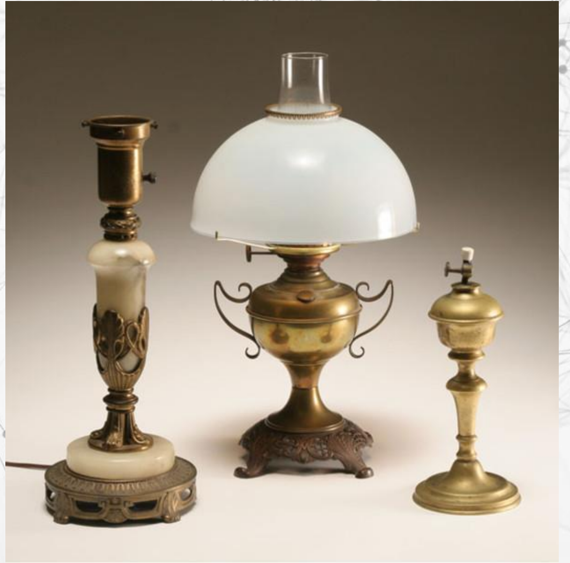
Керосиновая настольная лампа, 1895 г.