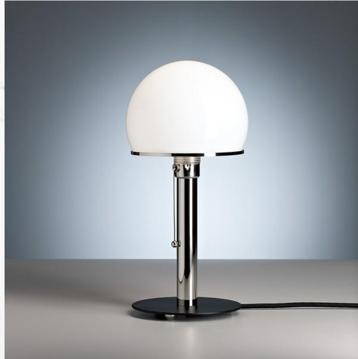
Модель Art 138 от фабрики Alivar, дизайн Wagenfeld Wilhelm